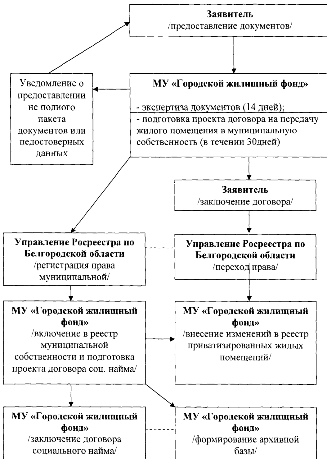
Схема предоставления муниципальной услуги

Начальник управления социальной защиты населения